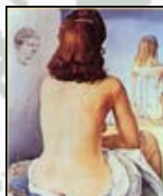
Gala, la femme de Dalí, 1945