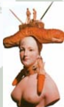
Buste de femme, 1933

12. Parfois il choque: on crie au scandale et on l'accuse ! Salvador Dali est ravi. Ce n'est pas simplement un très grand peintre, c'est aussi un immense comédien qui s'amuse à choquer les gens. Il se fait pousser d'incroyables moustaches et tient des propos révoltants, exprès pour énerver les gens et ... il gagne beaucoup d'argent. On le surnomme « Avida Dollars » qui est l'anagramme de son nom. A sa mort, en 1989, il est immensément riche.