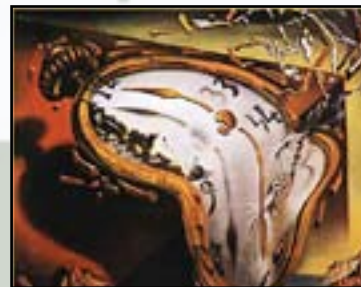
Montre molle, 1931

On trouve par exemple beaucoup de montres molles dans la peinture de Dalí ! Les peintres, qui, comme lui, peignaient des rêves, se sont appelés les « surréalistes ».