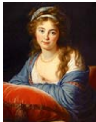
Comtesse Skavronskaja 1796

9. Heureusement pour elle, sa réputation l'a précédée et tous les aristocrates lui demandent des portraits. C'est ainsi que durant les neuf années que dure son exil, elle voyage dans toute l'Europe. En Suisse, elle se lie d'amitié avec Mme de Staël. En Russie, elle est reçue à la cour de Saint Pétersbourg par l'Impératrice, la grande Catherine II.