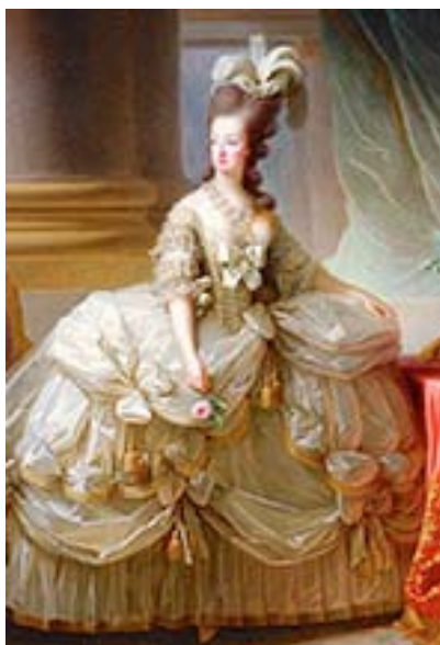
Marie-Antoinette en robe à panier 1778

7. Madame du Barry sait que la Reine Marie-Antoinette cherche un artiste pour faire son portrait, ainsi que celui de ses enfants. Louise-Elisabeth est donc présentée à la Reine. En 1778, elle exécute le premier portrait de la Reine, Marie-Antoinette en robe à panier . La Reine est si contente du résultat qu'elle ne va plus cesser de lui faire des commandes. Mme Vigée Le Brun devient sa protégée.