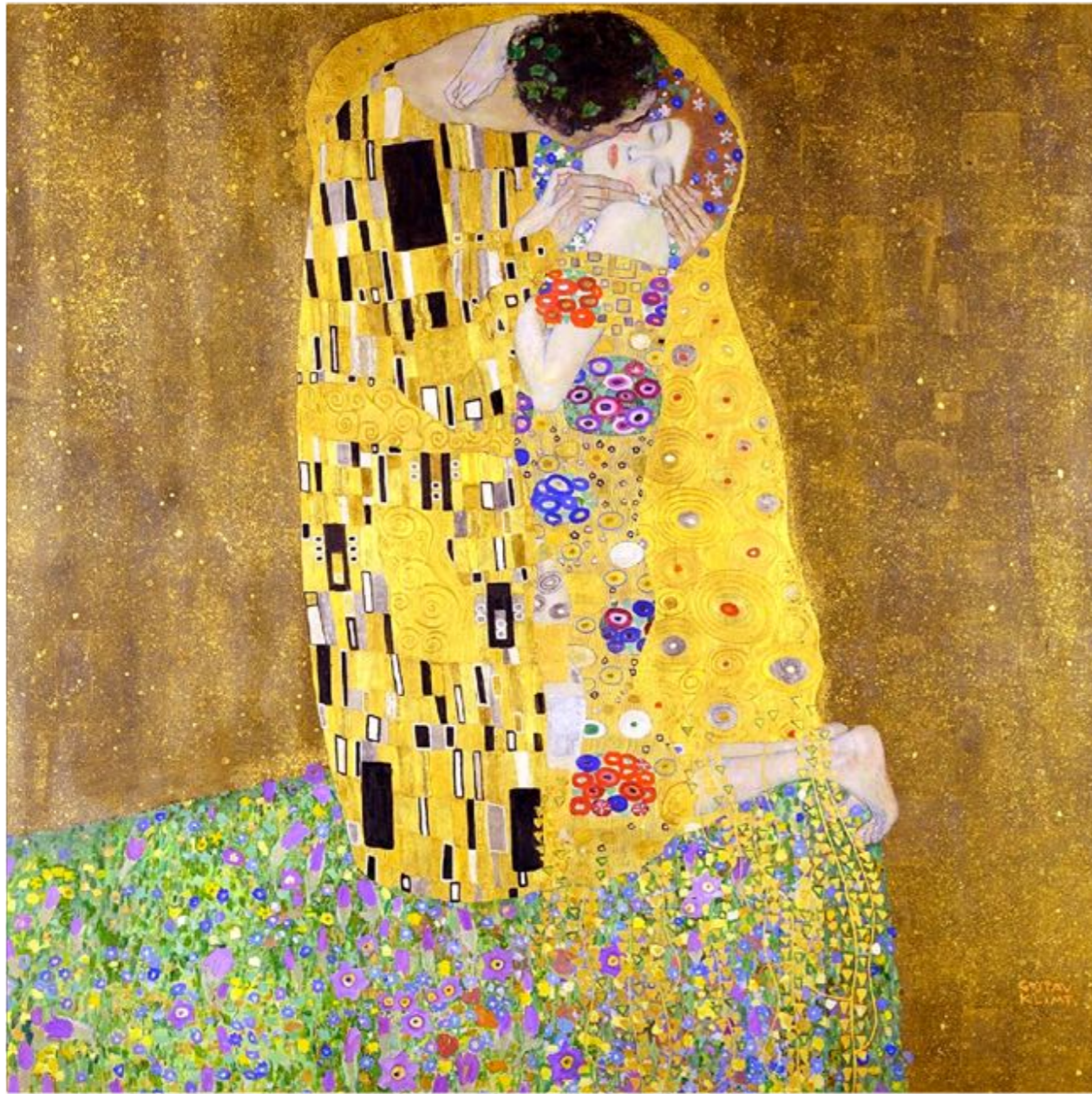
Le Baiser 1908

L'amour. C'est l'histoire d'une fille très belle qui rencontre un prince qui l'aime beaucoup. Ils ont un palais juste pour eux mais tout le monde peut y entrer à volonté.