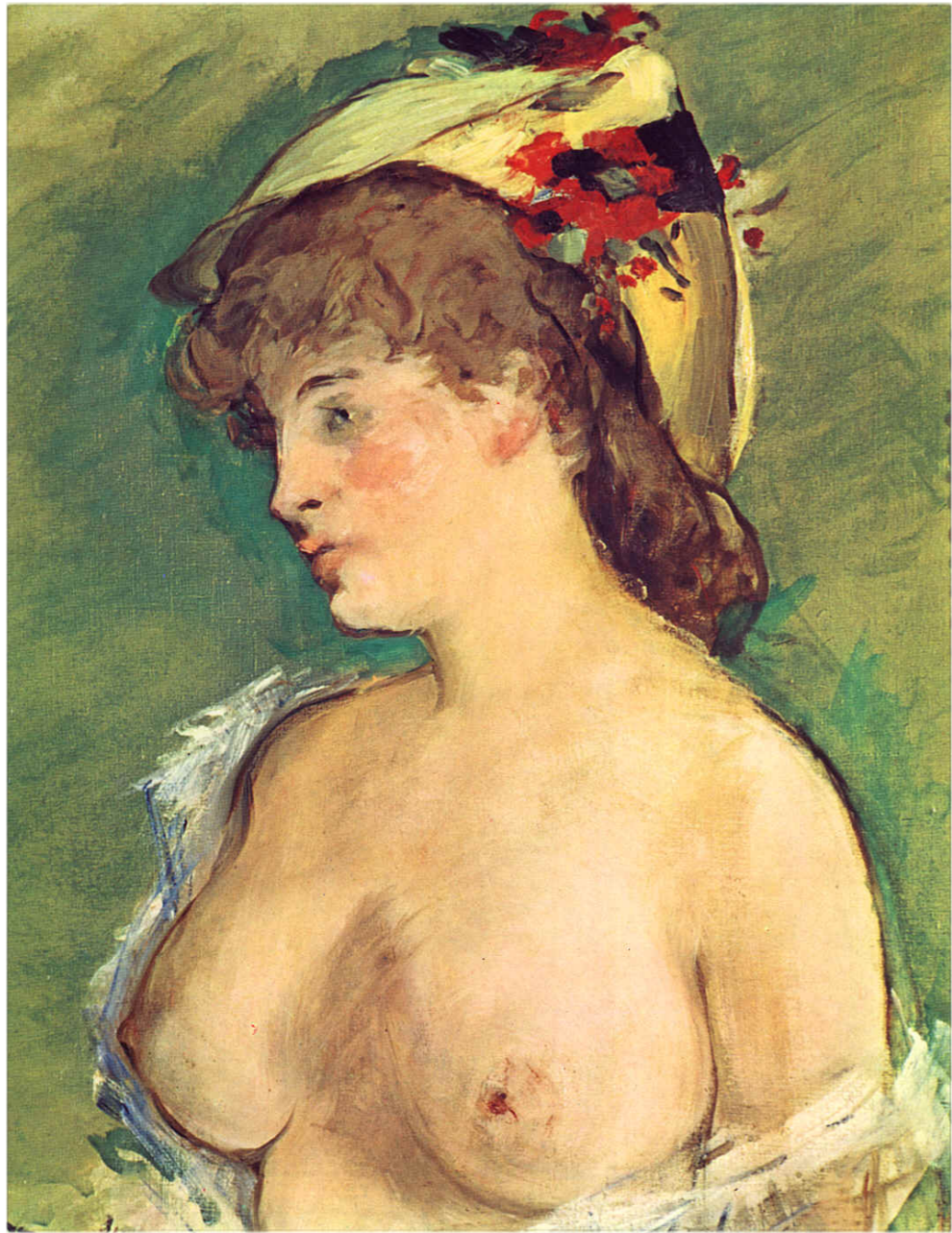
La blonde aux seins nus