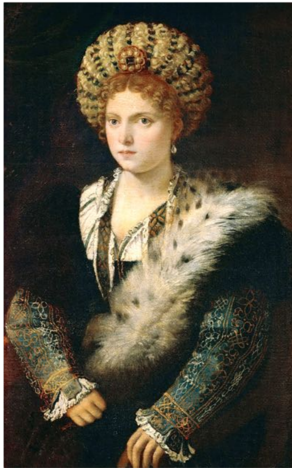
Isabelle d'Este 1534

On connaît le mot de Delacroix: « Si l'on vivait jusqu'à cent-vingt ans, on préférerait Titien à tout. »